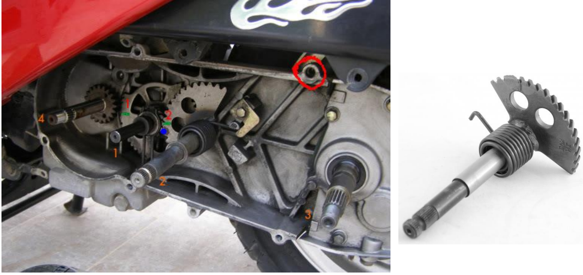
Şekil 4: Motosikletlerde kullanılan yarım ay dişli sistemi

kullanılmaktadır. Örneğin, motosikletlerde marş dişlisi olarak yarım ay dişli sistemleri kullanılmaktadır (Şekil 4).