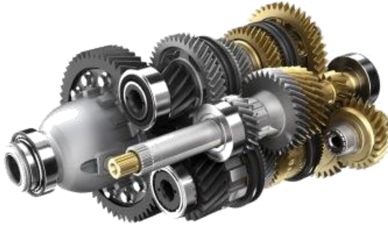
Şekil 5: Günümüzde kullanılan dişli kutuları

Burada kullanılan tasarımda, elevatör kepçesinin boyu 1,5 m kabul edilirse, kepçede toplam 11 kg su bulunması durumunda tork ihtiyacı 160 Nm, 22 kg su bulunması durumunda 320 Nm olacaktır. El-Cezeri'nin, tasarımında \frac{1}{2} transmisyon oranı kullandığı kabul edilirse, bir at kullanarak 11 kg olan taşıma kapasitesini 22 kg'a çıkarttığı söylenebilir. Sistemde taşıma kapasitesi arttırılırken, devir sayısının düşmesi nedeniyle toplamda iş kapasitesinin sabit kaldığı düşünülebilir. Ancak tasarlanan mekanik sistem, yüksek hızlarda çalışmaya uygun değildir ve mutlaka atın dönüş hızına göre yavaşlatılması gerekir. Atın yavaşlatılması gücünü arttırmayacaktır. Bu nedenle attan optimum güç ve devrin alınarak, sistemde transmisyon oranları değiştirilerek, torkun arttırılması önemli bir mühendislik başarısını ortaya koymaktadır. Transmisyon sistemleri günümüzde traktörler, otomobiller ve diğer araçlarda devir ve tork ayarlamalarında kullanılmaktadır. Araçların vites kutusu olarak adlandırılan ünitelerinde, farklı diş sayısı ve çaplara sahip dişli sistemleri ile bu düzenlemeler gerçekleştirilmektedir (Şekil 5). Günümüzde kullanılan dişli kutularında daha karmaşık sistemler kullanılmakta ve hareket halindeyken transmisyon değişimleri yapılabilmektedir. Ancak, bu sistemlerde El-Cezeri'nin tasarımındaki transmisyon oranı ilkesine göre çalışmaktadırlar.