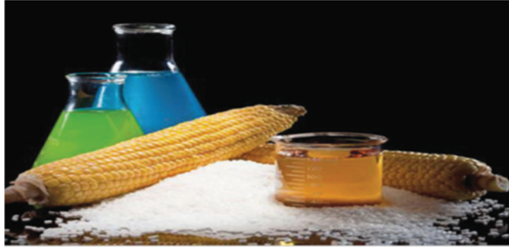
Şekil 1. Mısır biyoplastik üretiminde önemli bir ham madde

Doğada çok miktarda polimer bulunur. Ağaçlar, yapraklar, meyveler, tohumlar, hayvan derisi ve kemikleri gibi pek çok doğal maddenin yapısında polimer vardır. Bu maddeler insanlar tarafından çok eski çağlardan beri çeşitli uygulamalarda kullanılmıştır. Bu polimerlerin en önemli avantajı çevreyle dost malzemeler olmalarıdır. Ancak doğal polimerlerin çoğunun suda çözünmesi, bu nedenle de doğada çok hızlı bozunmaları, uzun süreli kullanım gerektiren uygulamalar açısından önemli bir dezavantajdır. Bu grubun iki üyesi endüstriyel açıdan önemli olan, selüloz ve nişastadır. Odundan elde edilen selüloz, polisakkarit grubunda yer alan doğal bir polimerdir. Selülozun yapısal eksiklikleri, hidroksil gruplarının nitrolanması veya asetillenmesi gibi kimyasal işlemler ile giderilir. Bu işlemler sonucu hazırlanan ticari plastik malzemeler 1950'den beri esnek yapılı ambalaj malzemesi olarak kullanılıyor (Gümüşderelioğlu, M., 2012).