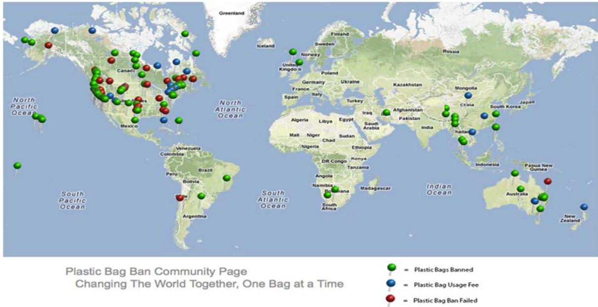
Şekil 4. Plastik torbaların yasaklandığı ülkeler ( www.thebagshare.org/p/bag-free-news.html )

Bazı gelişmiş ülkelerde plastik torba yasağının başarılı geçmediği Şekil 4’ te görülmektedir. Ülkemizde de uygulanması planlanan bu yasağın her alanda uygulanamayacağından istenilen verim alınamayabilir. Ülkemizde henüz yerli üreticiler tarafından bu ham maddelerin üretimi yapılmadığından yılda yaklaşık olarak 250-300 ton civarında biyoplastik ham maddesi ithalatı yapıldığı tespit edilmiştir. Türkiye de yaklaşık 50 milyon ton/yıl civarında toplam plastik ham madde talebini ve bunun içerisindeki 1,5 milyonluk plastik ambalaj ürettiğimiz dikkate alındığında, mevcut biyoplastik ham madde arzı henüz ülkemizdeki talepleri karşılayamayacak seviyededir.