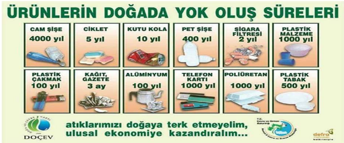
Şekil 5. Ürünlerin doğada yok oluş süreleri

Petrol bazlı plastikler doğada 1000 yıl, alüminyum 100 yıl, kutu kola 10 yıl, çiklet bile 2 yılda çözünmeden kalabilirken, biyoplastik bazlı poşetler 1 ile 6 ay içerisinde doğaya karışıp kompostlanabilir (Şekil 5). Bundan dolayı daha etkileyici bir çözüm olduğu düşünülen biyoplastik bazlı poşetlerle çevresel kaygılar tamamen azaltılmış olacaktır. Zamanla tüm plastik ambalajlarda kullanılarak istenilen yenilenebilir ham maddelere yönelim sağlanmış olacaktır.