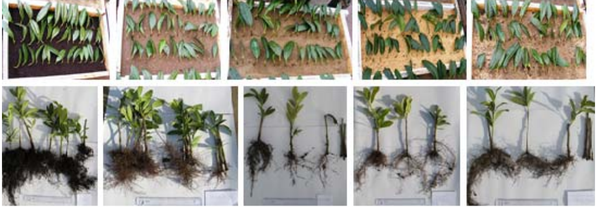
Şekil 1. Köklendirme ortamları ve köklü çelikler

Çeliklerde kök sayısı en düşük 6.33 adet ile dere kumu- hızar tozu- toprak karışımından hazırlanan ortamda, en yüksek olarak da 13.00 adet ile toprak ortamında tespit edilmiştir. Çeliklerin ortamlara göre köklenme oranı bakımından incelendiğinde en düşük köklenmenin %42.22 ile dere kumu-hızar tozu-toprak karışımından hazırlanan ortamda, en yüksek köklenme oranının ise %86.67 ile toprak ortamında olduğu tespit edilmiştir.